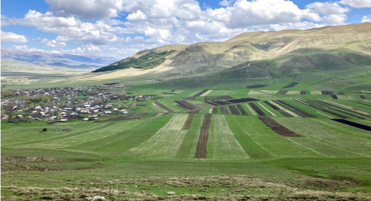
Das Dorf Hartagyugh im armenischen Hochland.

Liebe Freundinnen und Freunde von Little Bridge,